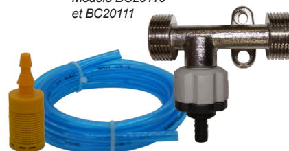
Modèle BC20110 et BC20111